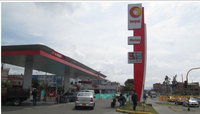
Fotografía de la estación de servicio TERPEL, la cual cuenta con más de un aviso en el canopy y los avisos tipo, separado de fachada y canopy no cuentan con registro de Publicidad Exterior Visual