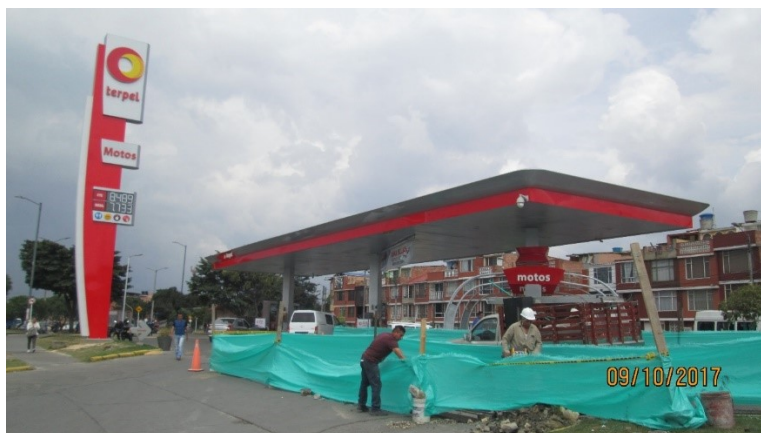
Fotografía de la estación de servicio TERPEL, la cual cuenta con más de un aviso en el canopy y los avisos tipo, separado de fachada y canopy no cuentan con registro de Publicidad Exterior Visual